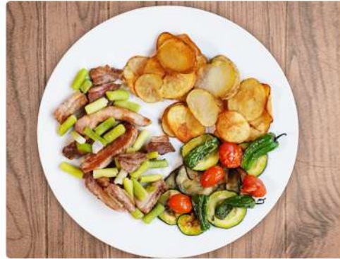
8. SECRETO IBERICO: 13€