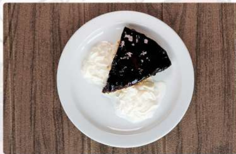
3. TARTA DE QUESO CON ARANDANOS: 4.00€