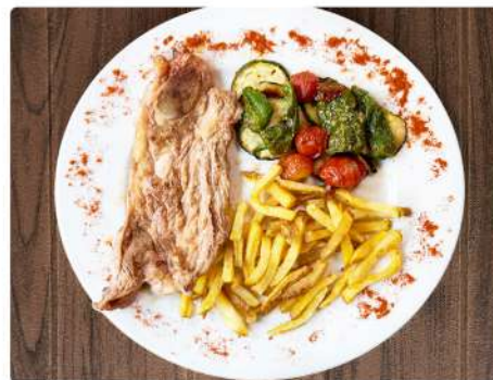
4. CHURRASCO DE TERNERA 13€