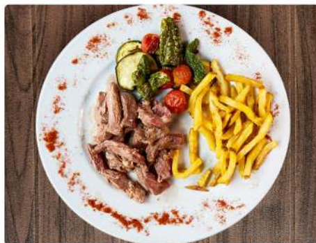
3. ENTRAÑA DE TERNERA 14€