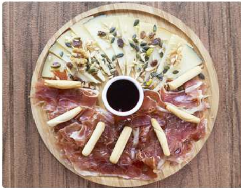
11. TABLA DE JAMÓN SERRANO Y QUESO MANCHEGO 16€