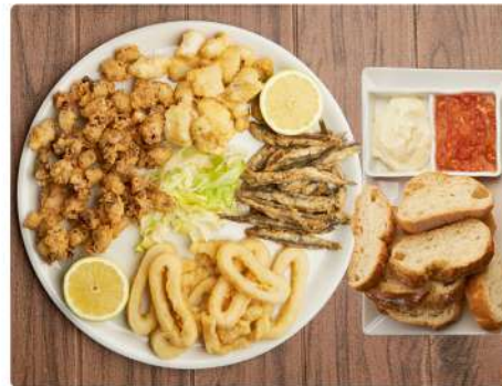
2. FRITURA 27€