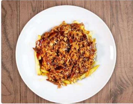
7. PATATAS RDC: 11€