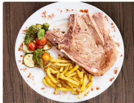
6. CHULETÓN DE TERNERA 400/500g .....18€ 700/800g ..... 23€

*Los precios tienen un suplemento del 10% en terraza*