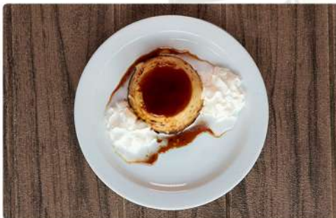
4. FLAN DE HUEVO: 3.00€