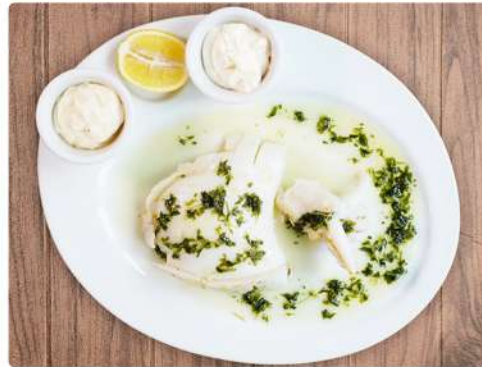
12. SEPIA: 12.00€

*Los precios tienen un suplemento del 10% en terraza*