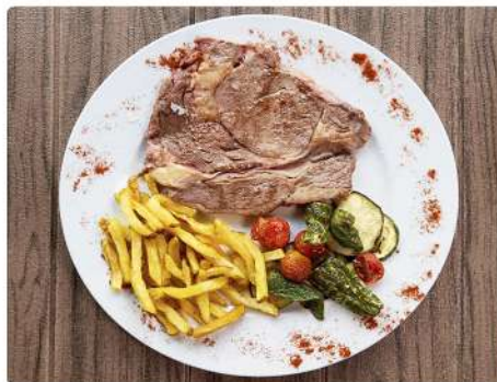
5. ENTRECOT DE TERNERA TRINCHADO 16€