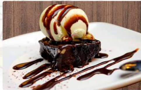
5. BROWNIE CON HELADO 5.00€

*Los precios tienen un suplemento del 10% en terraza*