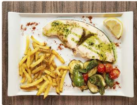
1. EMPERADOR 15€