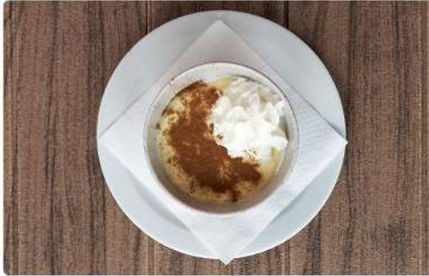
1. TIRAMISU: 3.50€