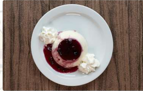
2. PANNA COTTA: 3.00€